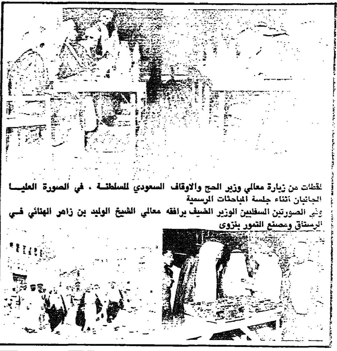
لقطات من زيارة معالي وزير الحج والوقاف السعودي للسلطنة . في الصورة العليا الجانبان أثناء جلسة المباحثات الرسمية وفي الصورتين السفليتين الوزير الضيف يرافقه معالي الشيخ الوليد بن زاهر الهنائي في الاستقبال ومصنع التصوير بنزوى

تودلبي - ١٠ - ١٠ - أكد الرئيس السوري حافظ الاسد ان التوصل الى سلام عادل في الشرق الاوسط لن يتم الا بانسحاب اسرائيل من جميع الاراضي العربية التي احتلتها عام ١٩٦٧ والاعتراف بحقوق الشعب الفلسطيني واقامة دولة لهم في اراضيهم وانهاء حالة الحروب في المنطقة وقال في مؤتمر صحفي عقده امس الاول في نيودلهي ان محادثاته مع رئيس الوزراء الهندي مورجاي نيساي والمسؤولين في نيودلهي كانت مثمرة ومفيدة ونكر الرئيس السوري ان سورية والهند قد وقعتا اتفاقية اقتصادية تهدف الى دعم التجارة بين البلدين ومن المقرر ان يختتم الاسد زيارته لنيودلهي - غدا -